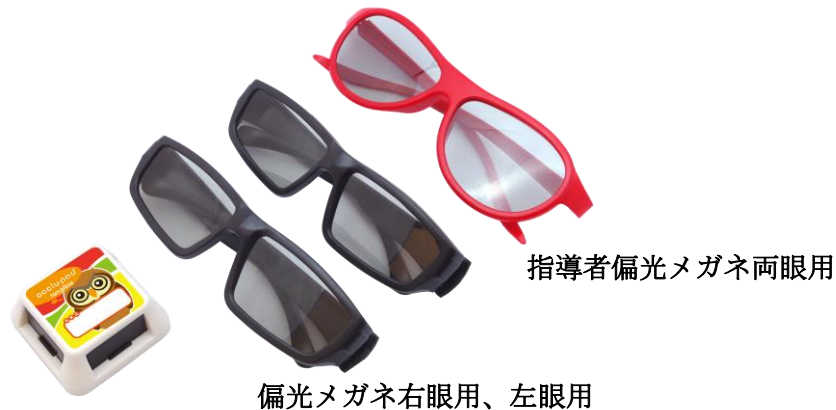
指導者偏光メガネ両眼用